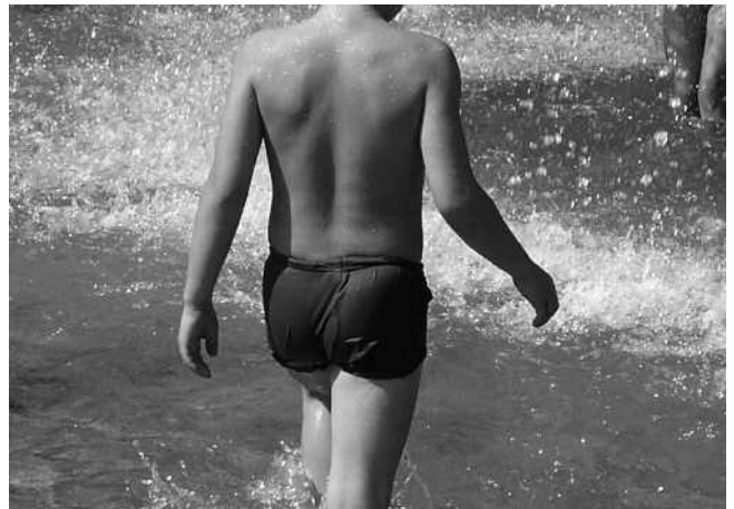
Der direkte Zugang zum Wasser kann auch im Offenbacher Hafen eine Hauptattraktion für Bewohner und Besucher werden.

Dabei geht es auch um technische Fragen der Wasseraufbereitung. Das Projekt Hafen Offenbach hat auf die umfassende Grundwassersanierung im Gebiet großen Wert gelegt und möchte dieses Qualitätsverständnis durch einen möglichst schonenden Umgang mit den unterschiedlichen Wasserquellen wie z. B. dem Regenwasser fortsetzen. Der verantwortungsvolle Umgang mit der wertvollen Umweltressource Wasser bleibt daher ein wichtiges Thema bei der gesamten Entwicklung des Hafengebietes.