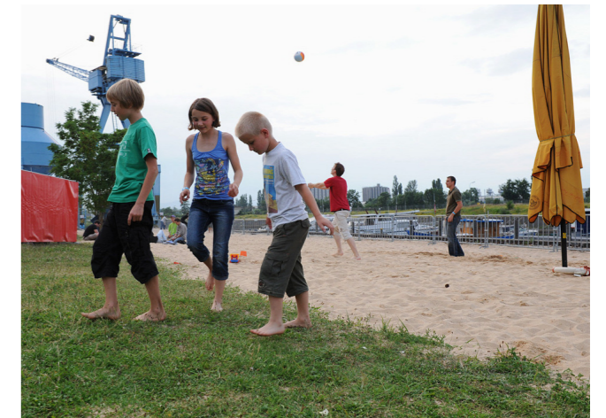
540 m 2 zusätzliche Rasenfläche

Seit diesem Sommer können die Kleinsten in einem riesigen Sandkasten gegenüber dem Kulturcafé Hafen 2 Burgen bauen. Denn nach dem Abriss eines Gebäudes hinter der Ölhalle wurde das Areal von Hafen 2 ausgedehnt und der Sandkasten enorm erweitert. Zwischen Sandkasten und Ölhalle wurden 540 m 2 Rasen neu angelegt und 22 Sattelzüge lieferten zusammen rund 670 Tonnen Sand an, um den Strand am Main zu gestalten. Übrigens: Platz gibt es dort auch für die Großen, die im Liegestuhl Strandatmosphäre am Fluss erleben wollen.