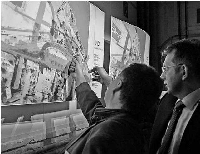
Bürgerversammlung am 28. Februar 2009 im Hafen 2