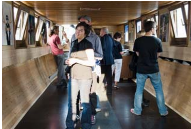
Ausstellungsschiff „Schute Vita“

„AUTOMATisierung, Mensch und Maschine“ lautete das Thema der „Tage der Industriekultur“ vom 10. bis 15. August 2010. Der Hafen lockte die Besucher dieses Mal mit