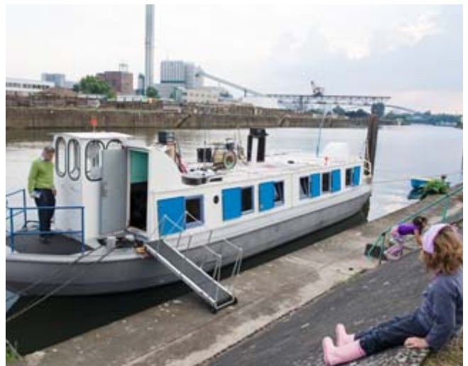
Ausstellungsschiff im Hafen Offenbach (Hafeninsel)

Senden Sie Ihre Antwort mit Ihrem Namen und Ihrer vollständigen Adresse auf einer mit 45 Cent frankierten Postkarte oder per Mail bis zum 15. November 2010 an: Mainviertel Offenbach GmbH & Co. KG, Projekt Hafen Offenbach, Senefelderstraße 162, 63069 Offenbach, oder an: info@hafen-offenbach.de . Der Rechtsweg ist ausgeschlossen.