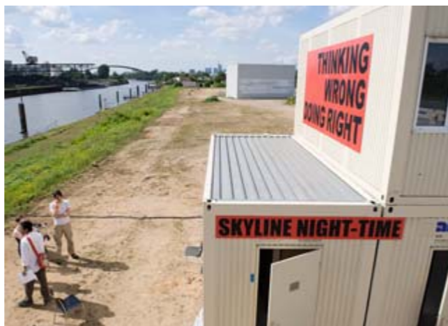
Kreatives Sommercamp „ProjectM“

Auf einer vom Projekt Hafen Offenbach organisierten Führung „Alles im Fluss. Der Hafen Offenbach im Wandel“ spürten die Teilnehmer der Historie des 1902 eröffneten Hafens nach. Der frühere Leiter des Stadtarchivs,