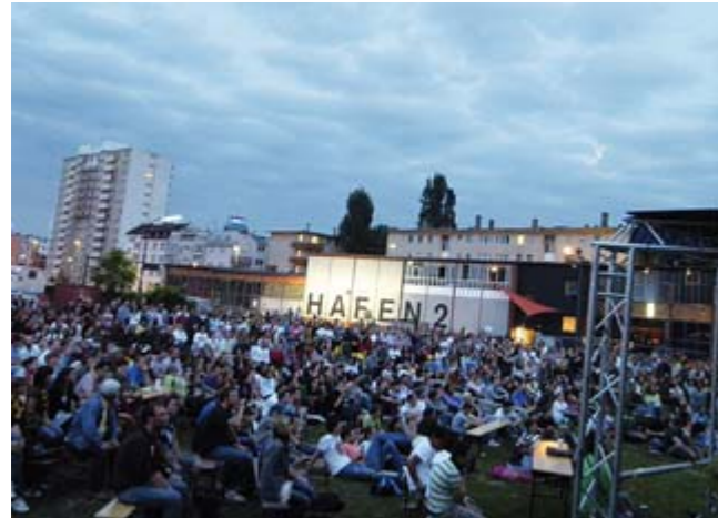
Public Viewing WM 2010

Der Hafen entwickelt sich zu einem beliebten Treffpunkt der Kreativen im Rhein-Main-Gebiet. Die einzigartige Stimmung regt Musiker, bildende Künstler und Filmemacher an. Ihre Projekte locken Scharen von Besuchern. Umgucken, mitmachen, entspannen. Am Hafen geht alles.