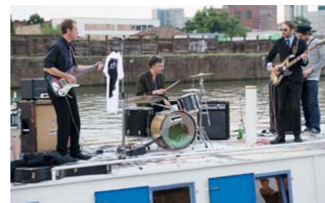
Musikperformance „The Rockers“

Der SOH-Cup (Stadtwerke Offenbach Holding) ist dabei, ein sportliches Highlight in Offenbach zu werden. In der heimischen Halle am Hafen boten die Kämpfer des BC Nordend-Offenbach und ihre Gegner von Eintracht Berlin den Zuschauern auch dieses Mal dramatische, emotionsgeladene Duelle. Die Offenbacher stiegen hoch motiviert in den Ring, um aus dem Unentschieden des vergangenen Jahres einen Sieg zu machen. Die Boxstaffel aus Berlin verlangte den jungen Kämpfern des BC Nordend-Offenbach starke Leistungen ab und ging zu Beginn in Führung. Nach 18 Kämpfen hatten die Offenbacher das bessere Ende für sich. www.boxclub-nordend-offenbach.de