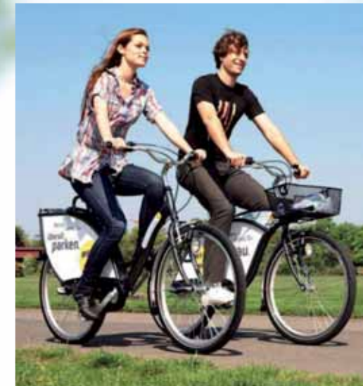
Anmelden und losradeln: Mit Nextbike geht's so einfach!

Seit den Osterferien herrscht wieder reges Treiben an den sieben Ausleihstationen in Offenbach: Begünstigt durch die milde Witterung haben schon viele Ausflügler die Möglichkeit genutzt, sich ein Nextbike-Leihfahrrad zu schnappen und durch die Kombination von Bus & Rad mobil zu bleiben.