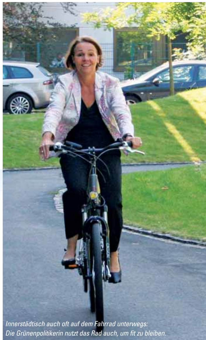
Innerstädtisch auch oft auf dem Fahrrad unterwegs: Die Grünenpolitikerin nutzt das Rad auch, um fit zu bleiben.

Im Gespräch mit der Redaktion des RMVmobil, Lokalteil Offenbach, äußert sie sich dazu, warum sie mitfährt – mit Bus und Bahn.