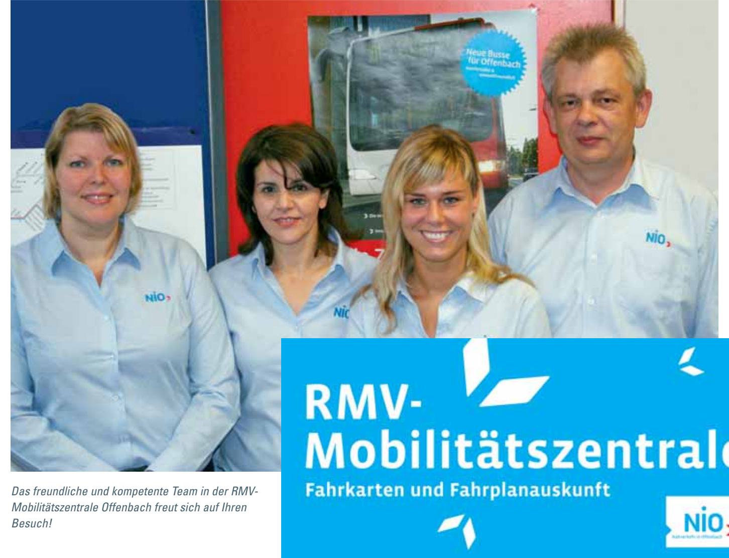
Das freundliche und kompetente Team in der RMV-Mobilitätszentrale Offenbach freut sich auf Ihren Besuch!