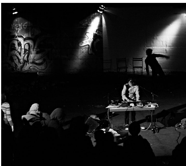
Das Festival junger Talente im Hafen Offenbach, 19.–21. September 2008

Kunst und Kultur prägen das Hafengelände schon jetzt. Ein gelungenes Beispiel dafür war das 4. Festival junger Talente vom 19. bis 21. September 2008, das die Hafensinsel in eine blühende Kreativlandschaft verwandelte. Studenten der Städelschule und der Hochschule für Musik und Darstellende Kunst in Frankfurt, der Offenbacher Hochschule für Gestaltung und des Instituts für Angewandte Theaterwissenschaft in Gießen präsentierten 40 Projekte. Junge Tänzer, Musiker und Schauspieler, Filmemacher und Installationskünstler bevölkerten das großflächige Areal gemeinsam mit einem interessierten Publikum – zu Lande und zu Wasser, unter Dächern oder freiem Himmel. Viele Ideen der Kreativen setzten sich direkt mit dem Hafen und seiner Geschichte auseinander. Zu den Höhepunkten gehörten ein vor Ort geschnittener Einbaum, der zur Überfahrt nach Frankfurt startete, eine Lichtinstallation mit Leuchtquellen aus der Natur sowie ein Steg, der das gesamte Gelände umspannte. Ergänzt wurde das Programm durch ein Konzert von Monotektoni und Les Bicyclettes im Hafen 2.