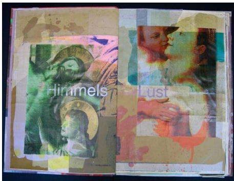
Schwarz : Himmelslust (2005)