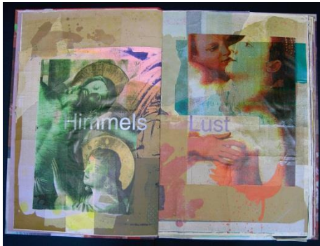
Schwarz : Himmelslust (2005)