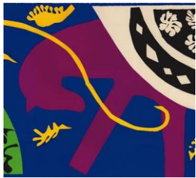
Matisse: Jazz (1947)