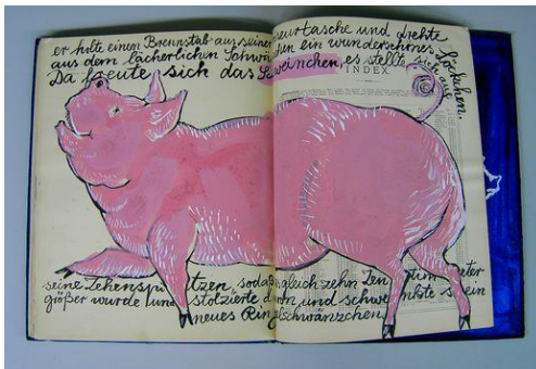
Kühnemann : Schweinchen (1999)