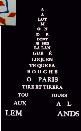
Apollinaire: Sept calligrammes (1967)