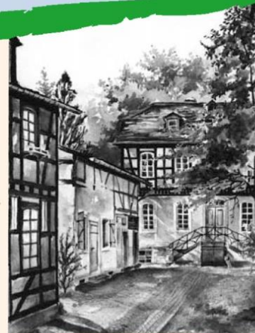
Einstiges Verlagshaus in der Domstraße

Im Jahr 1774 gründete Johann André in Offenbach einen Musikverlag, der rasch überregionale Geltung erlangte. Sein Sohn Johann Anton erwarb 1799 von Mozarts Witwe Constanze den Großteil der Notenhandschriften des Komponisten. Es handelte sich um mehr als 273 zumeist unveröffentlichte Werke. Zu deren Verbreitung trug bei, dass Johann Anton André den Erfinder der Lithographie, Alois Senefelder, anstellte.