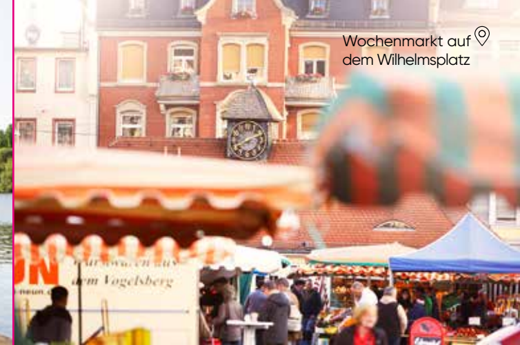
Wochenmarkt auf dem Wilhelmsplatz